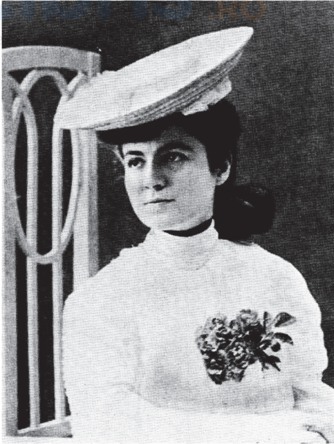
Mama lui Dinu Lipatti la vârsta de 17 ani.